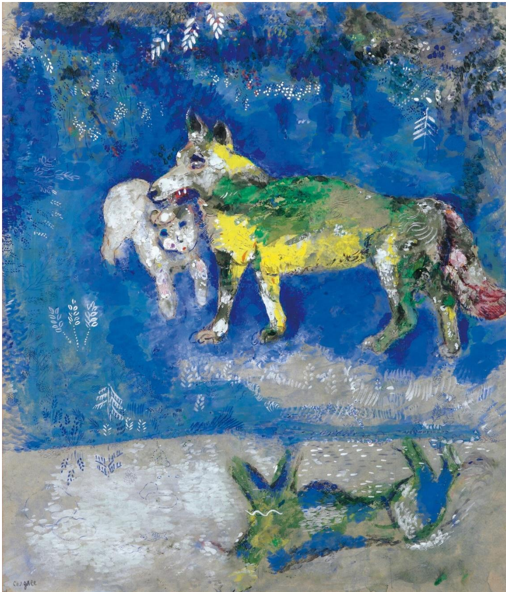
Marc Chagall, Le loup et l'agneau , gouache et crayon noir sur papier coloré, 49,8 x 43,5 cm, vers 1927